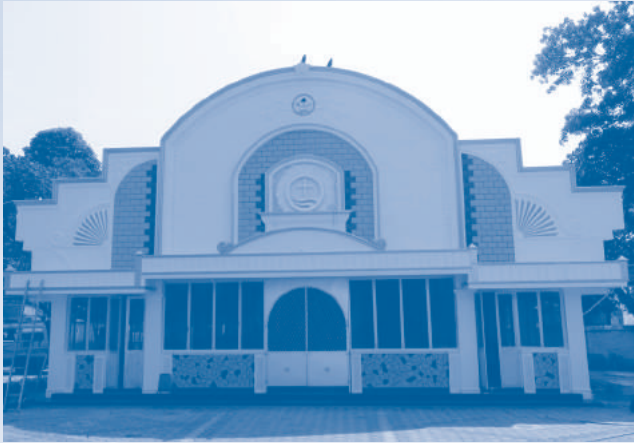
പരമേശ്വര സെമിനാരി ചാപ്പൽ