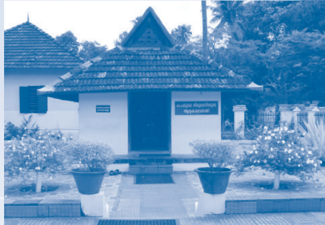
പരമേശ്വര തിരുമേനിയുടെ ആദ്യകാല വസതി