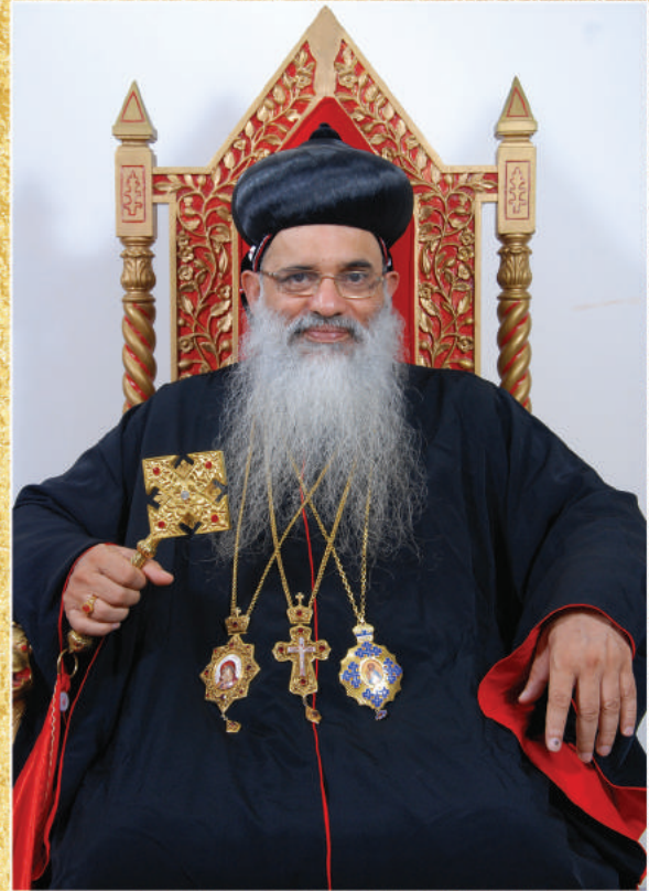
മലങ്കര മെത്രാപ്പോലീത്തായും പൗരസ്ത്യ കാതോലിക്കായുമായ പരിശുദ്ധ ബസേലിയോസ് മാർത്തോമ്മാ പുലോസ് ദ്വിതീയൻ കാതോലിക്കാ ബാവ